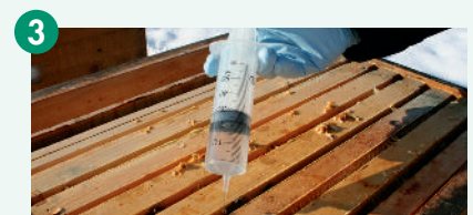
3 Behandlung mit der handwarmen und klaren Lösung starten.