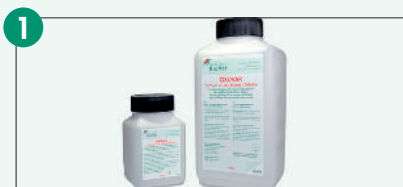
1 Siegelfolie entfernen