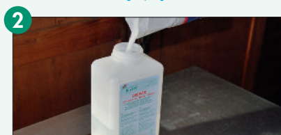
2 Zucker im Verhältnis 1:1 zur Lösung geben und gut schütteln.